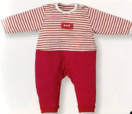
カーオーバー(5063)¥5,900 素材:ポーター子ニムシ 配色:R-NB サイズ:70-80