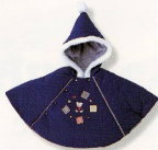
マント(3253)¥6,900 素材:ビーズシフォン 配色:M-NB-OW サイズ:80-90