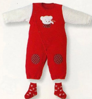
カーオーバー(5066)¥4,900 素材:フリース 配色:R-NB サイズ:70-80 ソックス(3265) ¥650 配色:IP-S-C-R-NB サイズ:7-9-9-10