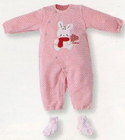
カーオーバー(5069)¥4,900 素材:裏毛 配色:IP-S-C-R-NB-M サイズ:70-80 ソックス(3264) ¥650 配色:IP-S-C サイズ:7-8-9-10