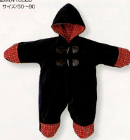
オクルミ(予定設計)(3247)¥9,000 素材:フリース 配色:NB-M サイズ:50-80