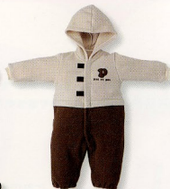
カーオーバー(5060)¥6,300 素材:フリース 配色:BJ サイズ:70-80