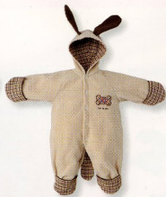
オクルミ(予定設計)(3244)¥10,000 素材:フリース 配色:IV サイズ:80-90