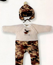
カーオーバー(帽子付)(5053)¥7,900 素材:フリース 配色:色 サイズ:70-80