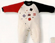
カーオーバー(5068)¥4,900 素材:裏毛 配色:IV サイズ:50-80