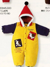
オクルミ(3235)¥13,000 素材:フリース 配色:Y サイズ:60-80